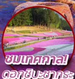
ชมเทศกาล ดอกชิบะซากุระ

📍 ไฮไลท์!! หุบเขาในฝัน คามิโคจิ ที่อยู่สูงชันทางเหนือเทือกเขาแอลป์ สัมผัสความงามของดอกชิบะซากุระ (Shibazakura Festival 2024) ย้อนยุคหมู่บ้านเอโดะ-จิว ณ เมืองเก้คาวาโกเอะ หมู่บ้านโอชิโนะฮัคโค **อิสระฟรีเดย์ ซอปปิง สนุก หรือ ท่องเที่ยวกรุงโตเกียว 1 วัน เต็ม**