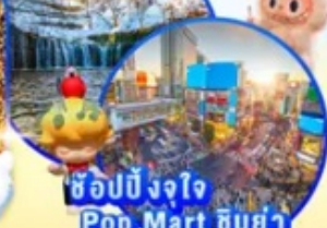
ช้อปปิ้งจุกใจ Pop Mart ชิบูย่า