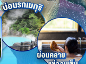
ออนเซ็น... แช่ออนเซ็น...