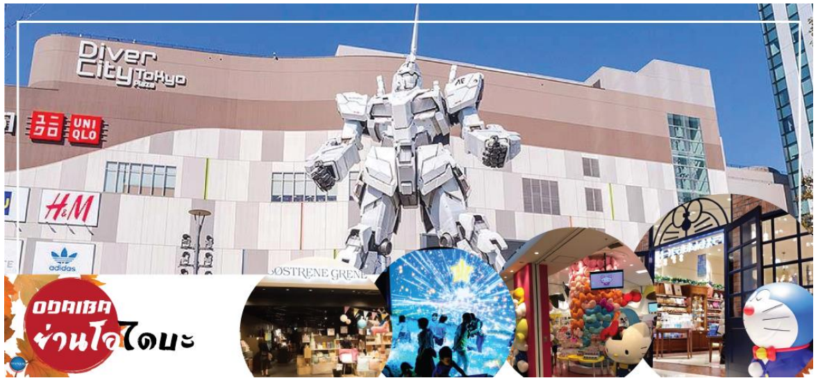
ออดิบะ ย่านโอไดบะ

นำท่านเดินทางสู่ ย่านโอไดบะ (Odaiba) (ใช้เวลาเดินทางโดยประมาณ 1.20 ชั่วโมง) เมืองคือเกาะที่สร้างขึ้นไว้เป็นแหล่งช้อปปิ้ง และแหล่งบันเทิงต่างๆ ในอ่าวโตเกียว ได้รับการปรับปรุงให้มีชื่อเสียงและเป็นที่ยอมรับในช่วงหลังของปี 1990 นอกจากมีสถาปัตยกรรมที่สวยงามตั้งอยู่มากมายแล้ว แต่ก็ยังคงความเป็นธรรมชาติไว้ด้วยความอุดมสมบูรณ์ของพื้นที่สีเขียว ไดเวอร์ซิตี โตเกียว พลาซ่า (Diver City Tokyo Plaza) เป็นห้างดังอีกห้างหนึ่ง ที่อยู่บนเกาะ โอไดบะ จุดเด่นของห้างนี้ก็คือหุ่นยนต์กันดั้ม ขนาดเท่าของจริง ซึ่งมีขนาดใหญ่มาก ในบริเวณห้าง อิสระช้อปปิ้งตามอัธยาศัย