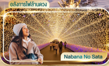
อสังการไฟลันดวง

เดินทางเทศกาลปีใหม่ 26 - 31 ธ.ค. 67 27 ธ.ค. 67 - 01 ม.ค. 68