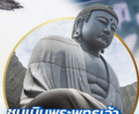
ชมเนินพระพุทธรเจ้า.. Hill of the Buddha