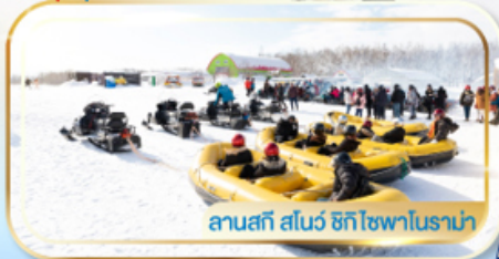
ลานสกี สโนว์ ฮักโซฟาโนราม่า