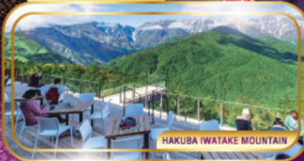
HAKUBA IWATAKE MOUNTAIN