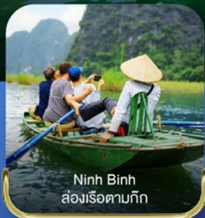
Ninh Binh ล่องเรือตามกัก