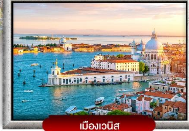
เมืองเวนิส

📍 ซอปปิง 4 เมือง ปารีส อินลาเก้น มิลาน โรม