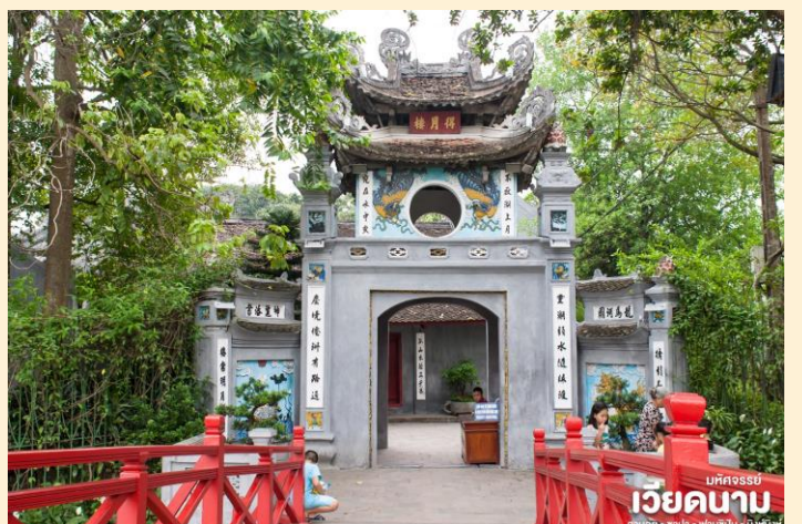
มณฑลจอร์เจีย เวียดนาม ฮานอย • ซาปา • ฟานซิปัน • นิงห์ฮิงห์

จากนั้น นำท่านชม สะพานแสงอาทิตย์ สีแดงสดใสสู่กลางทะเลสาบคืนดาบ ชมวัดโบราณ วัดห็อกเซิน (ด้านนอก) สถานที่แห่งนี้มี เต่าสตัฟ ขนาดใหญ่ ซึ่งมีความเชื่อว่า เต่าตัวนี้ คือเต่าศักดิ์สิทธิ์ 1 ใน 2 ตัวที่อาศัยอยู่ในทะเลสาบแห่งนี้มาเป็นเวลานาน