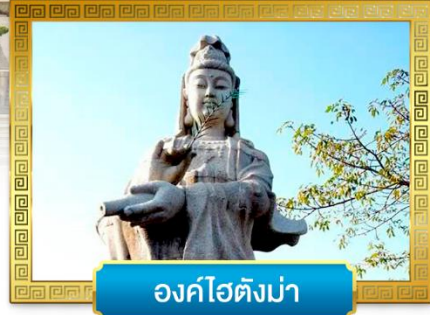
องค์ไฮตังม่า