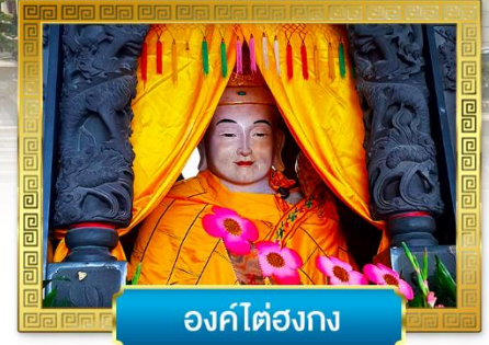
องค์ไต๋องกง