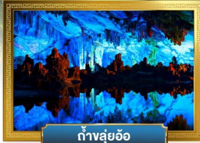
ถ้ำหลุย้อ