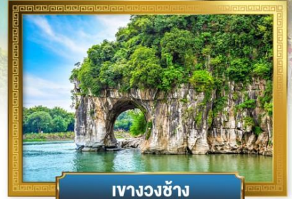
เหวางวงซ่าง