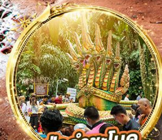
ปากำชะโนด