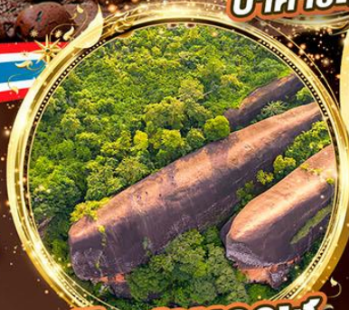
หินสามวาฬ