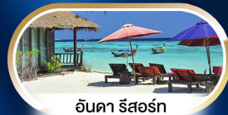
อินคา รีสอร์ท