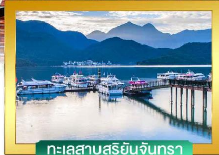
ทะเลสาบสุริยันจันทรา