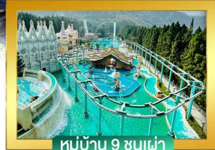
หมู่บ้าน 9 ชนเผ่า