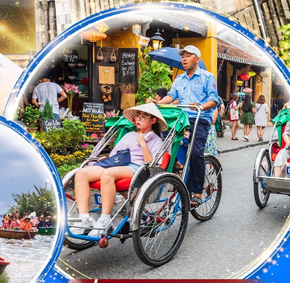
นั่งรถสามล้อไซโคล

พักบน บานาฮิลล์ 1 คืน นั่งกระเช้าที่ยาวที่สุดในโลก ขึ้นสู่บานาฮิลล์ ชมเมือง ฮอยอัน เมืองมรดกโลกที่สวยงามและเจียบสงบ พิเศษ!! บุฟเฟ่ต์นานาชาติ บานาฮิลล์