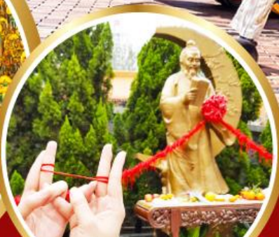
เจ้าแม่กวนอิมฮ่องกง วัดหวังต้าเซียน