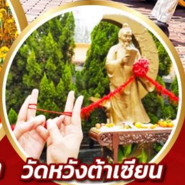
เจ้าแม่กวนอิมฮ่องกง วัดหวังต้าเซียน