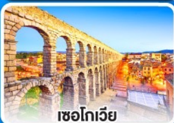
เซโกเวีย