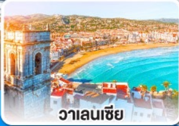
วาเลนเซีย