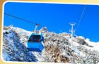
กระเช้าใหญ่ขึ้นภูเขาหิมะมังกรหยก