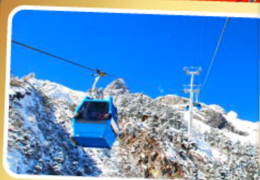
กระเช้าใหญ่ขึ้นภูเขาหิมะมังกรหยก