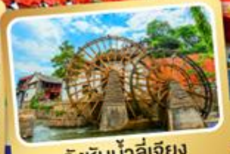
กังหันน้ำลี่เจียง