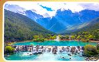
หุบเขาน้ำเงินทะเลสาบโป๋สุยเหอ