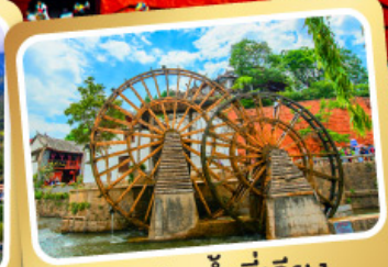
กังหันน้ำลี่เจียง