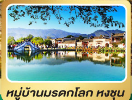
หมู่บ้านผดกโลก หงซุน