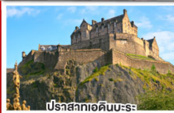
ปราสาทเอ็ดินเบิร์ก

เยือนสโตนเฮนจ์ และ พิพิธภัณฑน์โรมันโบราณ