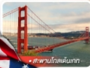
สะพานโกลเด้นเกต