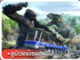
ยูนิเวอร์สอลสตูดิโอ