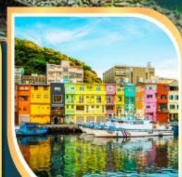
ท่าเรือเจิ้งปิ่น