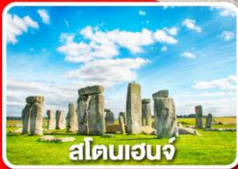
สโตนเฮนจ์