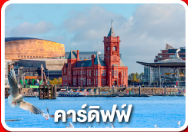
คาร์ดิฟฟ์