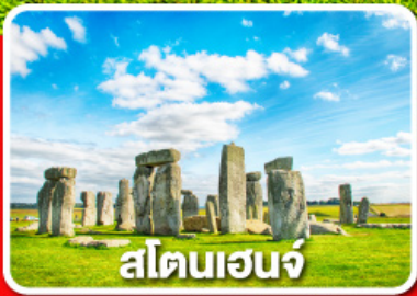
สโตนเฮนจ์