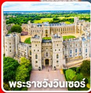
พระราชวังวินเชสเตอร์

พักลอนดอน 4 คืนและ อิสระให้ท่านได้เที่ยวลอนดอนแบบเต็มอิ่ม 1 วัน