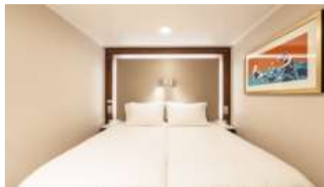
พัก 1-2 ท่าน

From 13 - 14 sq.m Max Occupancy 2-4^ Deck 5/8/9/10/11/12/13/15 2 Single Beds / 2 Single Beds + 1 Ceiling Pullman Bed / 1 Single Bed + 1 Pullman Bed + 1 Double Sofa Bed