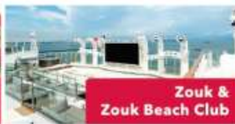
Zouk & Zouk Beach Club