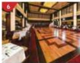
Dream Dining Room

Indulge in European-style butler service and exclusive facilities.