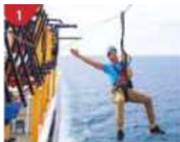
Ropes Course & Zipline

Feel the thrill of gliding above the ocean on a 35-metre zipline.