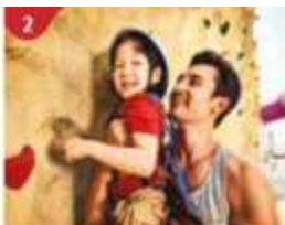
Rock Climbing Wall

Feel the thrill of gliding above the ocean on a 35-metre zipline.