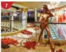
Johnnie Walker House™

Savour a wide variety of Asian and international cuisine.