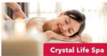
Crystal Life Spa