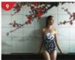
Crystal Life™ Spa

Relish contemporary Western cuisine from the internationally-acclaimed Australian chef.