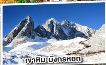
เขาสหิมะมังกรหยก