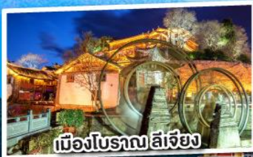
เมืองโบราณ ลี่เจียง