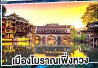
เมืองโบราณเฟิงหวง