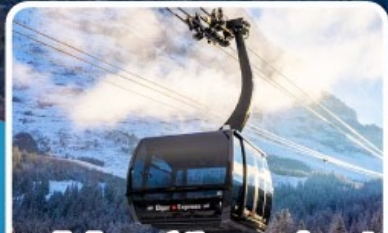
กระเช้า ไอเกอร์เอ็กสเพรส สู่อยอดเขาจุงเฟรา

อิตาลี สวิตเซอร์แลนด์ ฝรั่งเศส 10 วัน 7 คืน