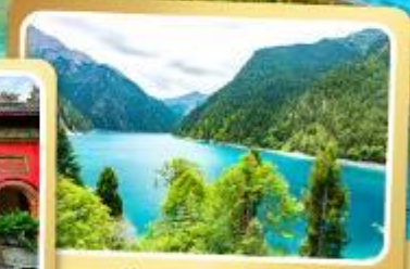
ทะเลสาบยาว