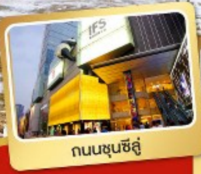
ถนนชุนชี่ลู่