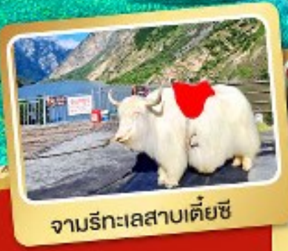
จามรีทะเลสาบเตี้ยซี