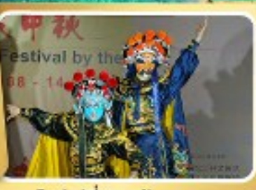
โชว์เปลี่ยนหน้ากาก