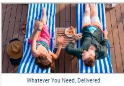
Whatever You Need, Delivered