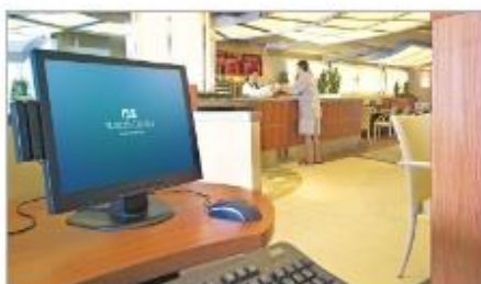
Internet Café & Library