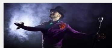
Featured Guest Entertainers