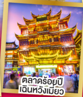
ตลาดร้อยปี เงินหวังเหมียว