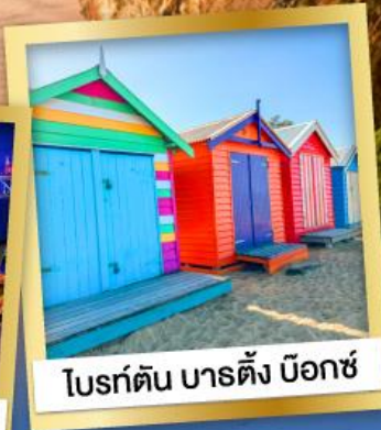
ไบรท์ตัน บาร์ดิง บ็อกซ์

03-10, 12-19 เม.ย.68 24 เม.ย.-01 พ.ค.68 08-15, 22-29 พ.ค.68 29 พ.ค.-05 มิ.ย.68