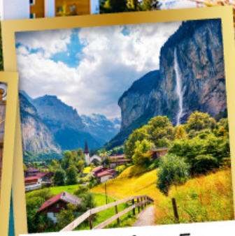
เลาเทอร์บรุนเนิน