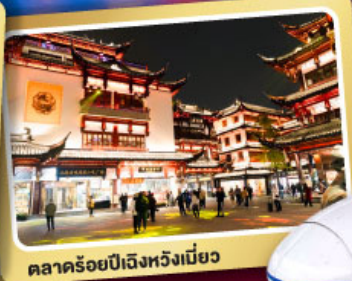
ตลาดร้อยปีเฉิงหวงเหมียว