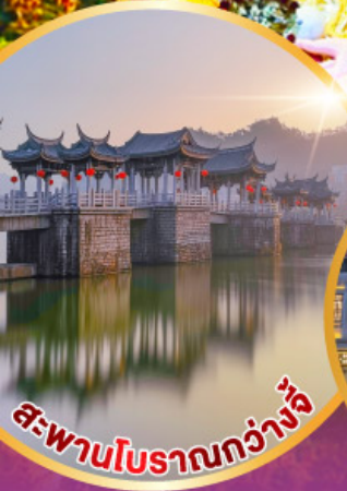
สะพานโบราณกว้างจุ