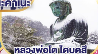
หลวงพ่อโตโดบุตสึ