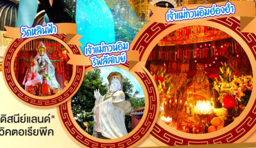
วัดหลินฟ้า

สนุกสนานไปกับดินแดนสุดหรูหราแบบเต็มวัน "ดิสนีย์แลนด์" ชมจุดชมวิวฮ่องกงแบบพาโนรามาจากยอดเขาวิคตอเรียพีค นั่งกระเช้ามองปิงสักการะพระใหญ่เทียนถาน