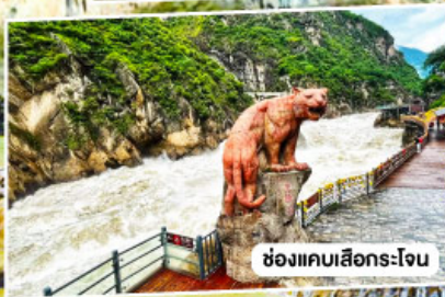
ช่องแคบเลือกระใจ