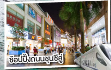
ช้อปปิ้งถนนชุนชี่