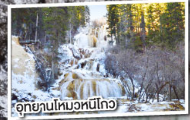
อุทยานโหมวหนีโกว