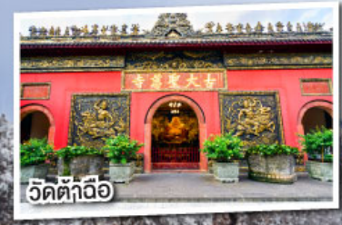
วัดต้าถื่อ