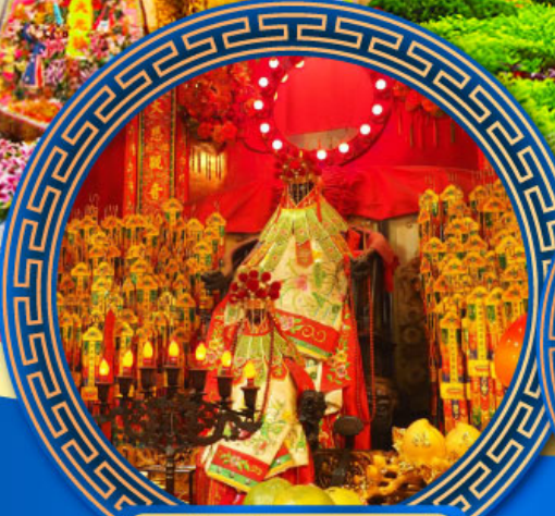
วัดเจ้าแม่กวนอิมฮ่องฮ่า