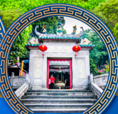
วัดอาม่า มาเก๊า