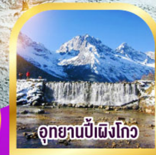
อุทยานป่าเผิงโกว