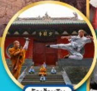
วัดเส้าหลิน ตำนานกังฟู