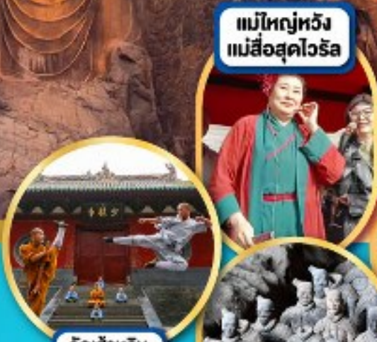
แม่ใหญ่หวัง แม่สื่อสุดไวรัล