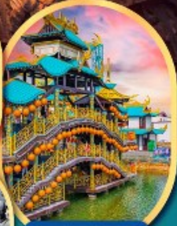
เขาว่านชู่ซาน นครจอมยุทธ