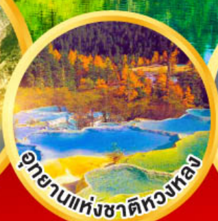
อุทยานแห่งชาติหลงหลง