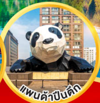
แพนด้าปิ่นดึก