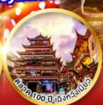
ศาลา 100 ปี เจียงหนิงเมี่ยว