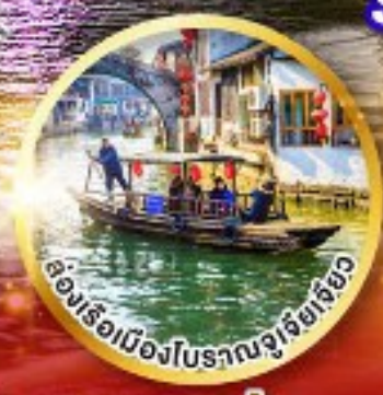
ล่องเรือเมืองโบราณซูโจว