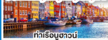
ท่าเรือชวาน์

ล่องเรือสำราญสุดหรู DFDS พร้อมห้องพักแบบ Sea View