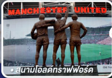
สนามโอลด์แทรฟฟอร์ด