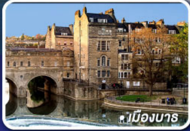
เมืองบาส